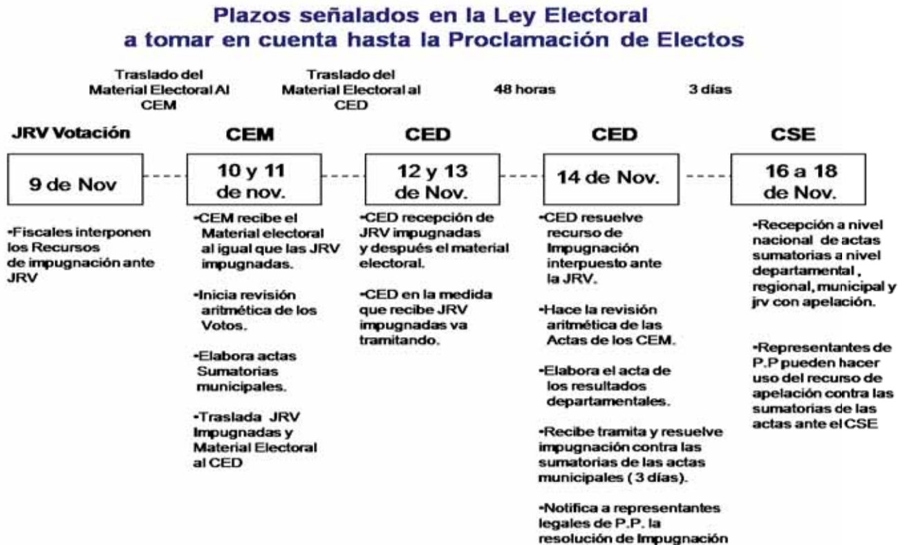
Gráfico No. 3

Nicaragua tiene 153 municipios, de los cuales en 146 se realizaron las elecciones municipales el 9 de noviembre. En estas elecciones se abrieron 11,308 JRVs ubicadas en 4,047 Centros de Votaciones.